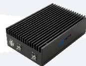
Available 220V System Benchtop Amplifier